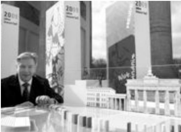
Démonstration du projet le 16 juin 09 avec Klaus Wowereit, maire de Berlin.

"Nous avons donc décidé aujourd'hui de prendre une disposition qui permet à tout citoyen de la RDA de sortir du pays par les postes-frontières de la RDA..." - "À partir de quand ?" - "Pour autant que je sache... immédiatement... sans délai". Ces propos sont extraits de la conférence de presse donnée en direct et par erreur à la télévision par le membre et nouveau porte-parole du bureau politique du SED, Günter Schabowski, le 9 novembre 1989. Suite aux fortes pressions de la population, le parti SED avait publié le 6 novembre un projet de loi sur la régulation des entrées et de sorties du territoire de la RDA, afin de juguler l'exode continu vers la république Tchèque. Comme il y eut de grandes manifestations le 9 novembre, le texte de loi fut remanié en profondeur, avec l'introduction d'un droit de voyager avec visa obligatoire. La confusion des informations dans l'annonce à la télévision provoquera une vive réaction chez les Berlinoises, qui se dirigeront aussitôt de part et d'autre des postes frontières, contraignant les gardes en faction, perplexes et sans ordre, à ouvrir les barrières. 20 ans après, dès le 7 novembre prochain, sur environ deux kilomètres entre la place de Pots-